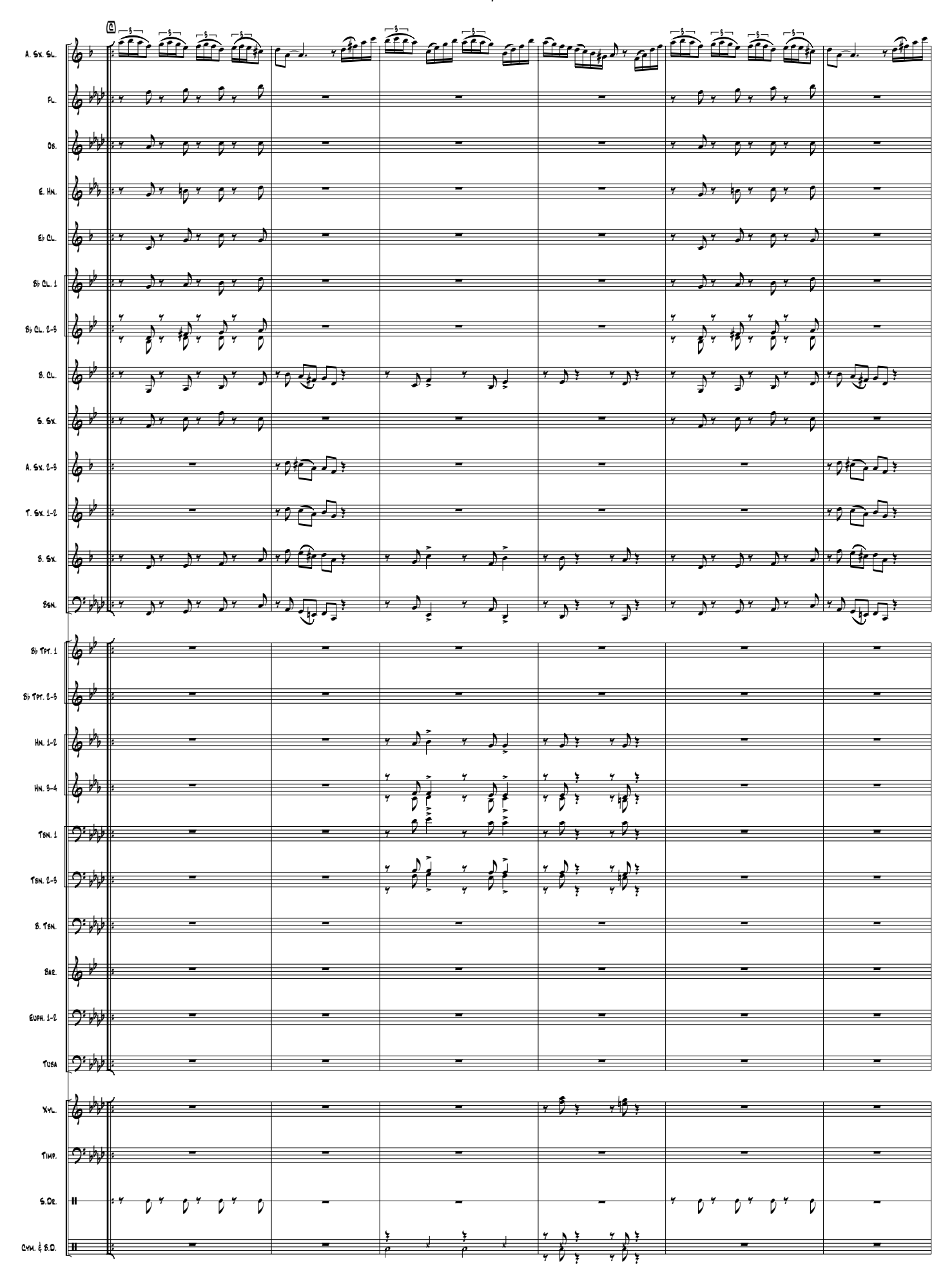
ESSELUNGA - ILIO VOLANTE