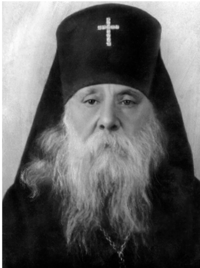
Архиепископ Пражский Сергей Королёв L'archevêque Serge Koroliou de Prague