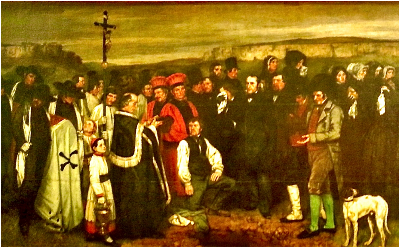
Un enterrement à Ornans Gustave Courbet (1819-1877)