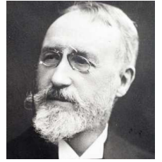
Theodore Dubois 1837 - 1924