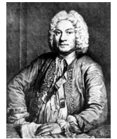
François Couperin (1668-1733)