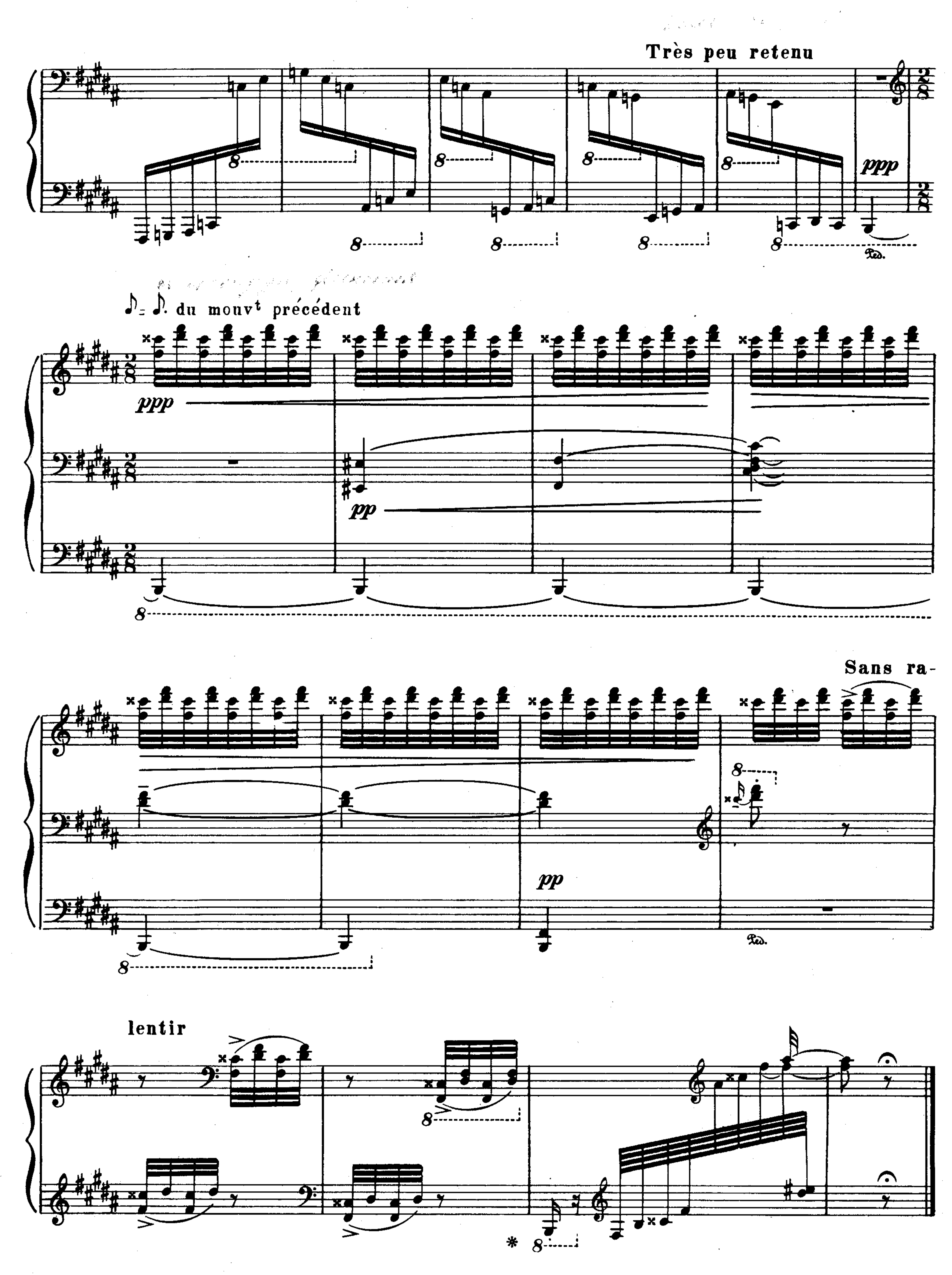
с 2086 к