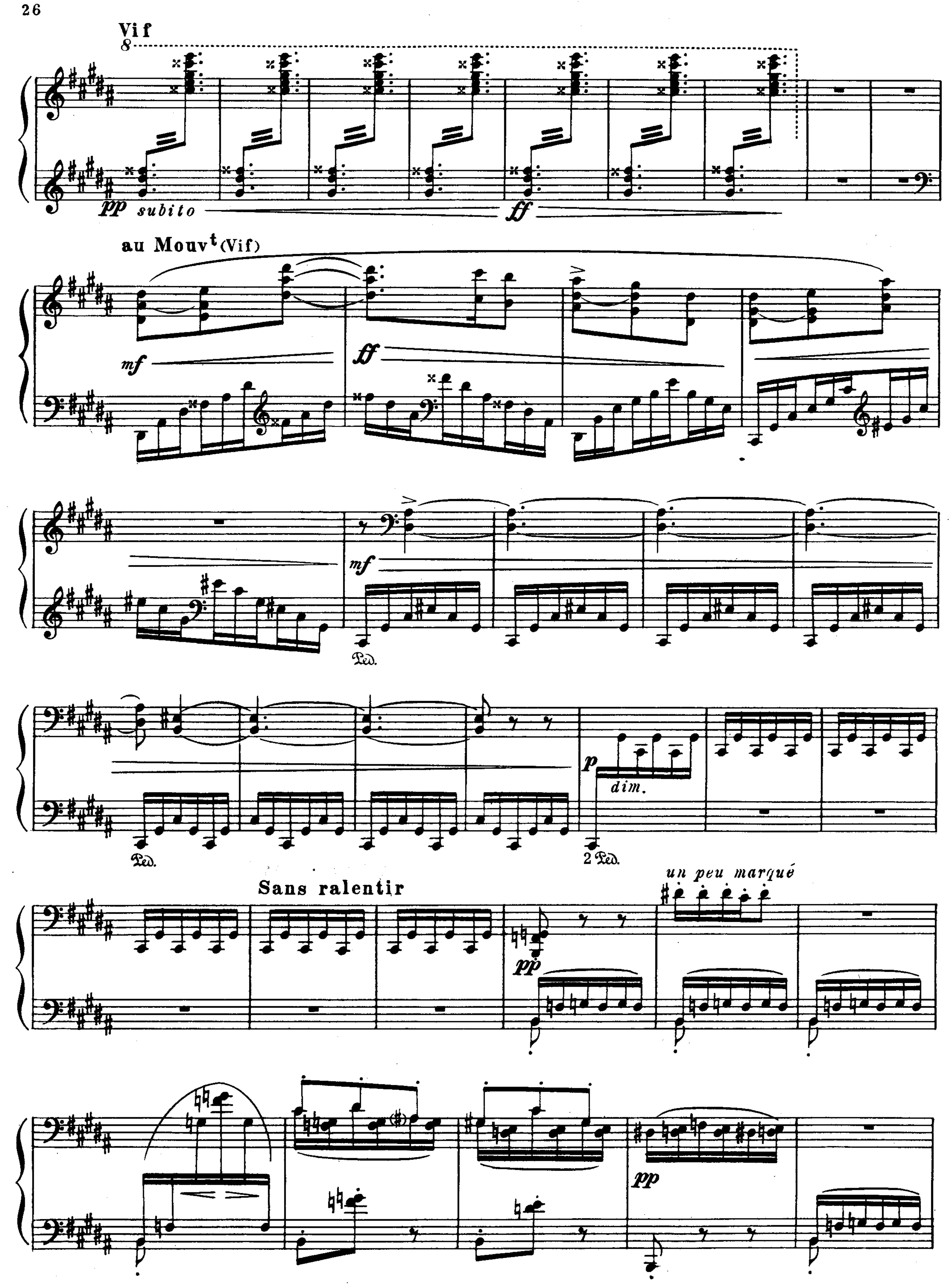
с 2086 к