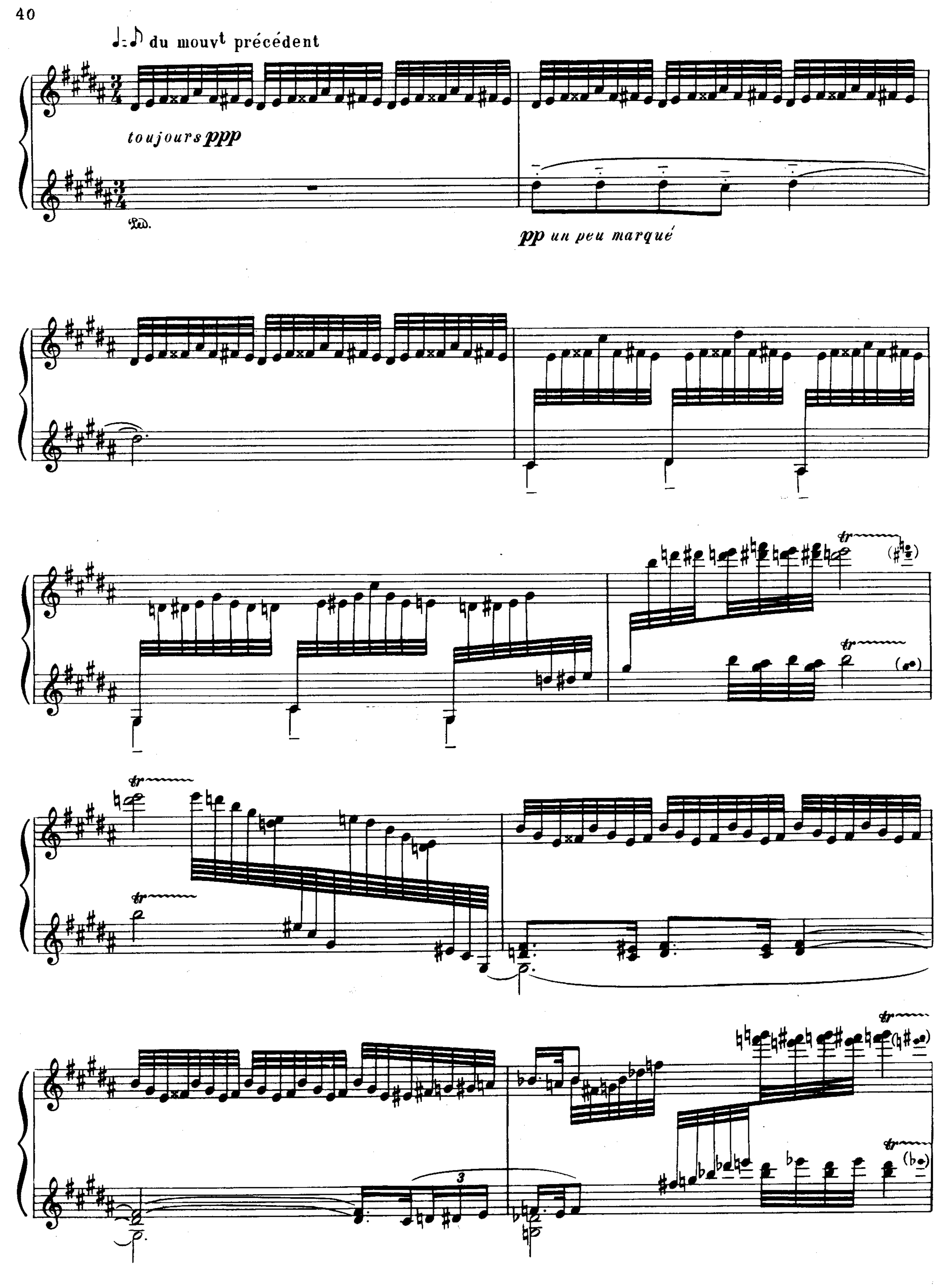
с 2086 к