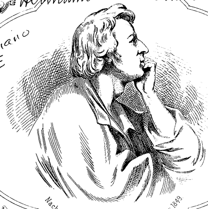
Nach einer Zeichnung von T. Kowiatkowski, Paris 1849.