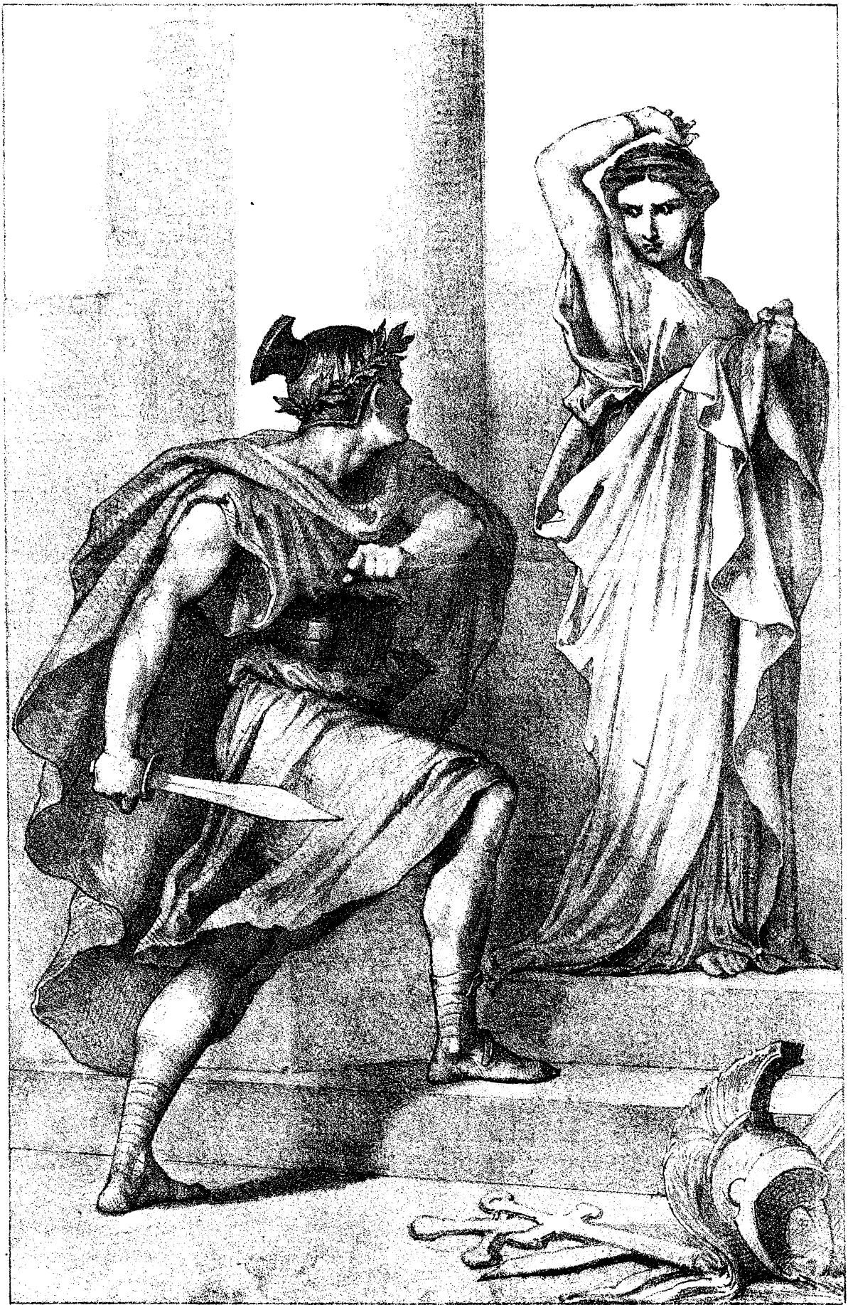
CHAZAL INV. LAMBERT-LITH.