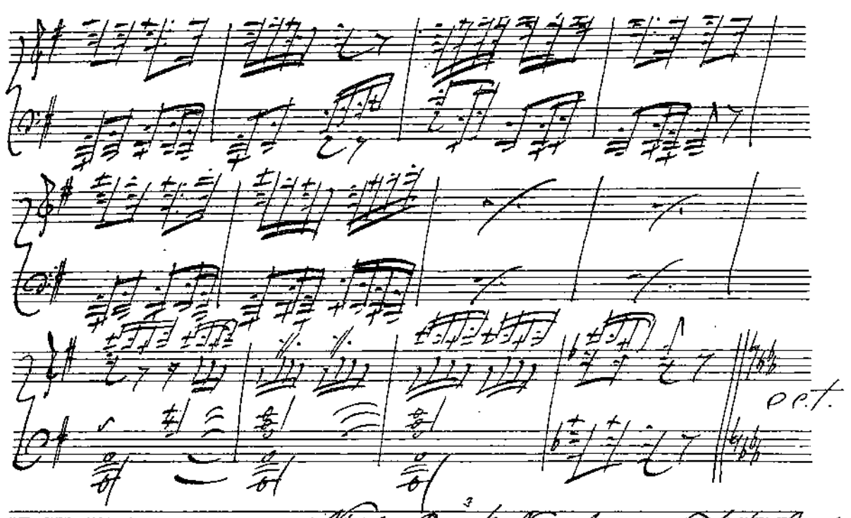
MANUSCRIT AUTOGRAPHE DE RIMSKY-KORSAKOW, LE GRAND MUSICIEN RUSSE DONT L'OPÉRA COMIQUE VIENT DE REPRÉSENTER UN CHEF-D'ŒUVRE, Snegourotschka .