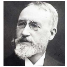
Theodore Dubois 1837 - 1924