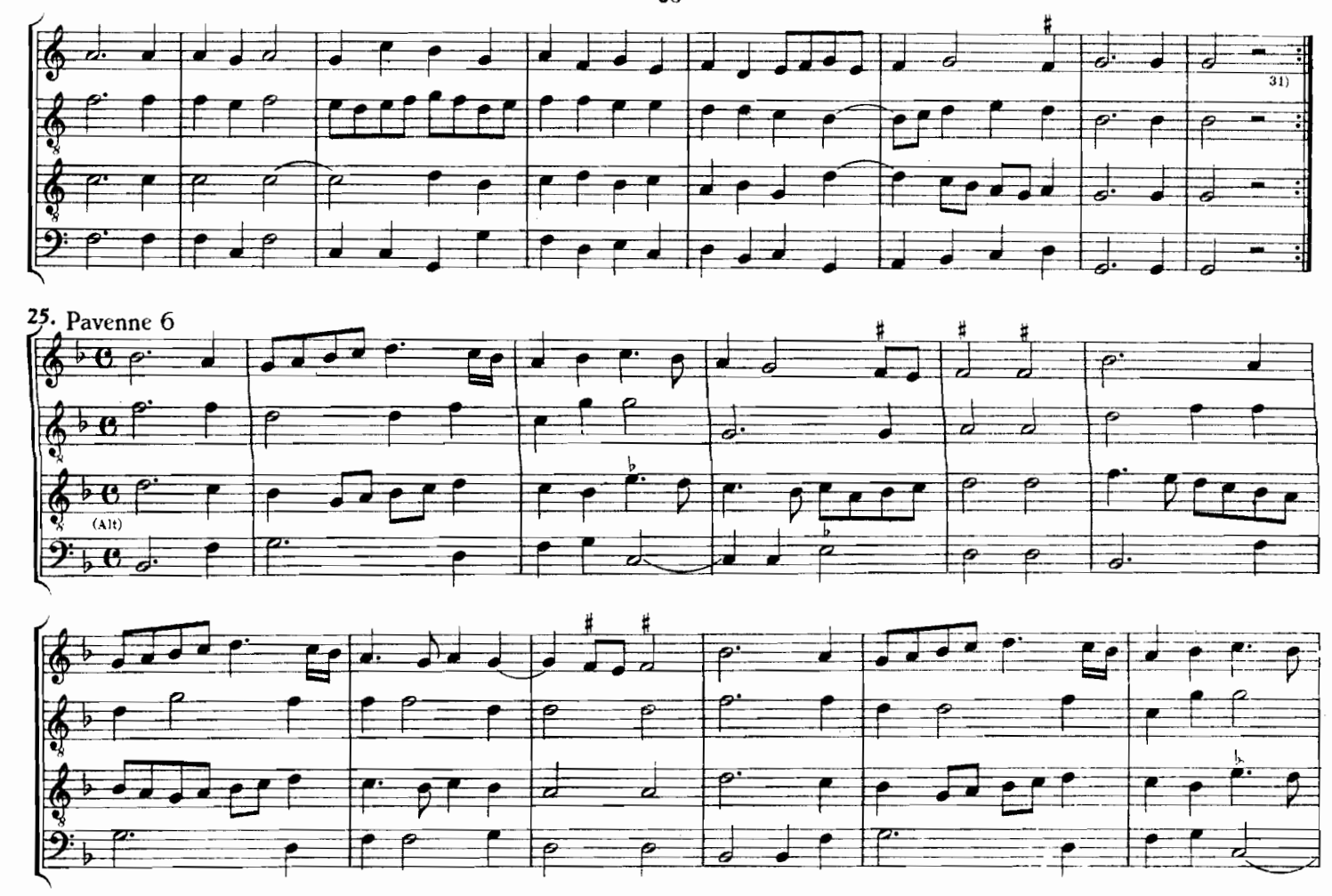
Verlage: 31) Pause fehlt