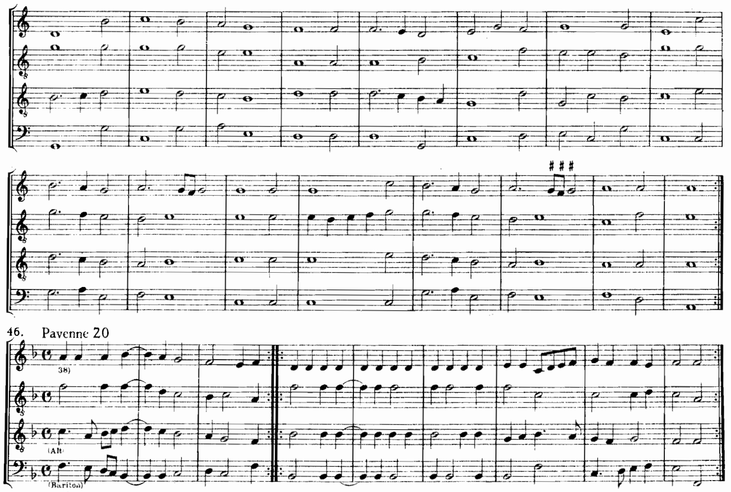
38) Die genaue Übertragung der Vorlage ergibt diesen Satz, dossen Merkwürdigkeit kaum durch die Vermutung einzelner Druckfehler erklärt werden kann